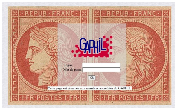
Figure 01 – La zone a accès protégé.

Le site du GAPHIL reprend toutes les anciennes données avec l'ajout d'une zone protégée pour échange des fichiers de fonctionnement, ainsi que l'ajout d'un 'Répertoire des Timbres' qui recense les timbres français émis par la Poste depuis 2015, sans aucun affichage publicitaire.