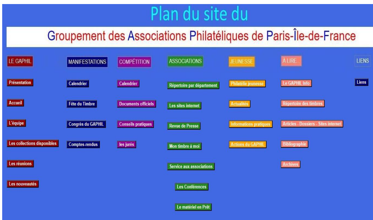
Figure 04 – le plan du site.

Sur la première page et dans les pieds de page, on peut voir l'ensemble des rubriques.