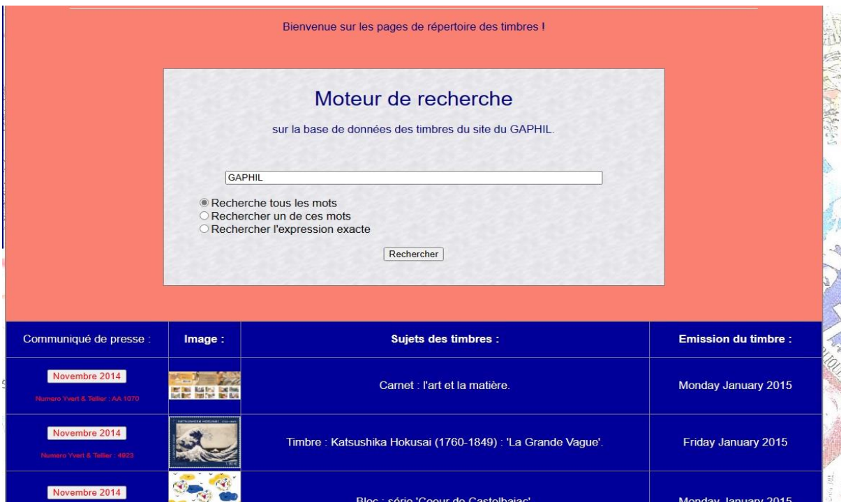
Figure 06 – Le moteur affiche les pages recherchées.

Un moteur de recherche situé au début du 'répertoire des timbres' permet de faire une recherche rapide et précise sur toute la base de données des timbres en ligne.