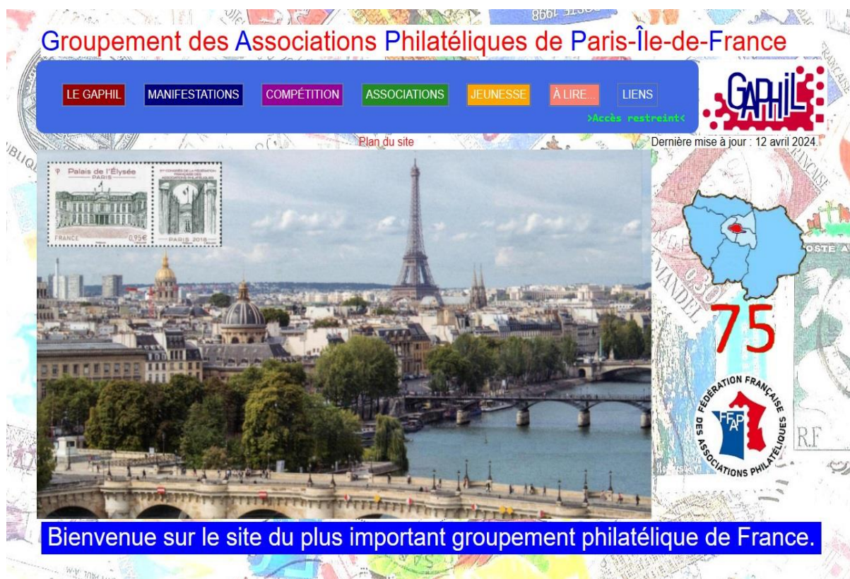
Figure 03 – la première page du site.

A la première page, la barre de navigation permet d'accéder à l'ensemble du site. Au-dessous un lien vers le 'plan du site' permet de voir l'ensemble des rubriques. Au milieu à gauche se trouvent des images défilantes pour illustrer chaque département d'Île de France avec une carte postale et un timbre. A droite apparaît une carte cliquable qui ouvre la page 'Association' au département sélectionné. Cette page affiche la date de dernière mise à jour. Il y a aussi un lien vers le site de la F.F.A.P.