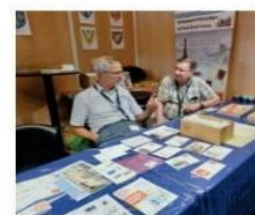
Figure 02 - L'éphéméride et l'animation imagée.